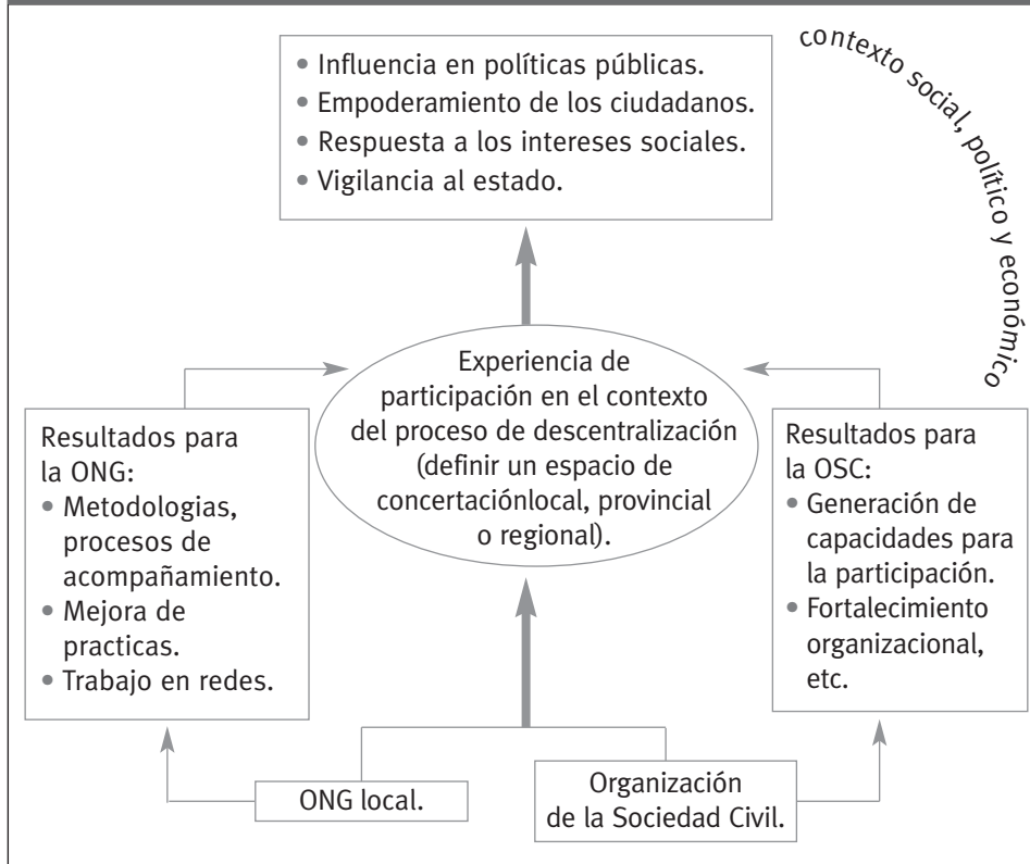
Cuadro 10. Estructura de la sistematización de las experiencias de participación ciudadana