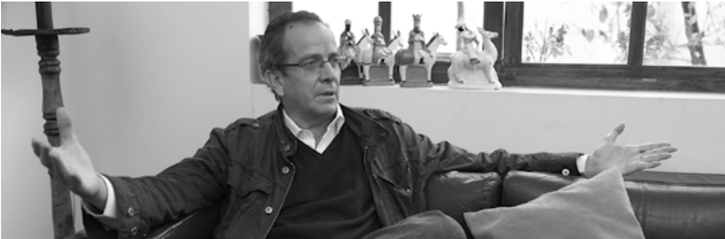
Irudia: Alberto Acosta.

Alberto Acosta: Ekuadorreko ekonomialaria. Unibertsitateko irakaslea; batez ere Garapenaren Teoriak gaiaren katedraduna Ekuadorreko eta atzerriko hainbat unibertsitatetan. Energia eta Meategietako Ministroa (2007), Batzar Konstituziogilearen presidentea (2007-2008), Errepublikaren Presidentetzarako hautagaia (2012-2013). Gizarte mugimenduetako borroka kidea.