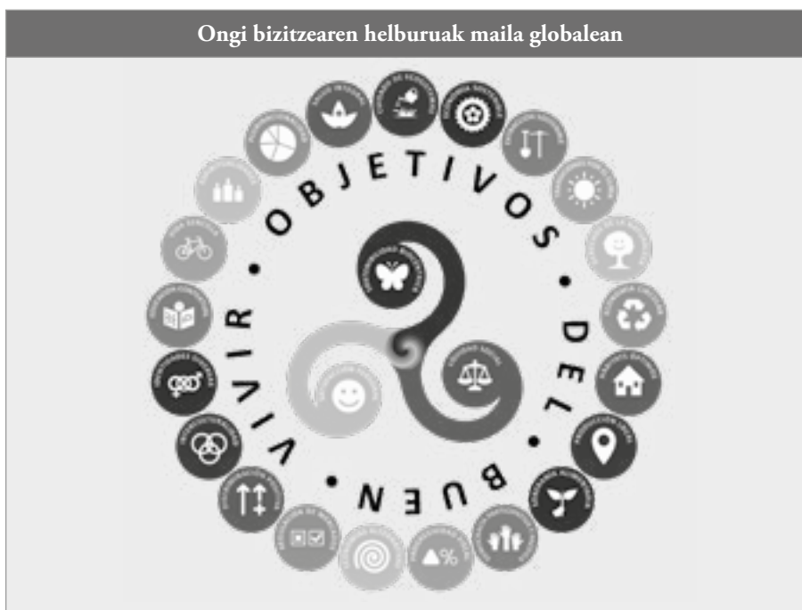
Irudia: Hidalgo-Capitán et al. (2018: 85).

Helburu orokorrak lortzeko, aldi berean berariazko helburuak lortu beharko lirатеke; lehenengo hirurak ezin izango lirатеke lortu, aldi berean bigarren hogeita batak lortu gabe. Gainera, berariazko hogeita bat helburuek harreman estua izango lukete beren artean, bereziki hiru harmonietako batekin zuzeneko lotura dutenen artean. Irudi honetan, ongi bizitzearen hogeita lau helburu globalen egitura sistemikoa azaltzen da, hiru harmoniek zehaztutako hiru ardatzen inguruan egituratuta.